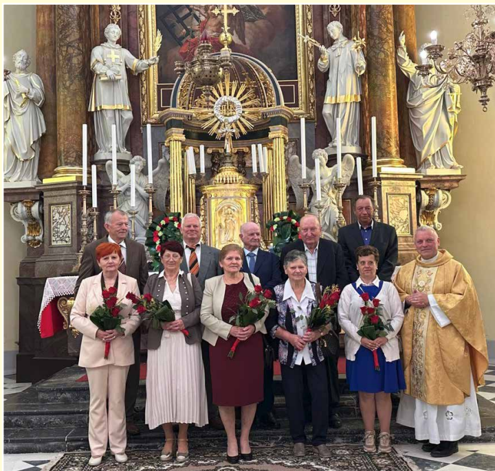
Raka, jubilarci: 17. 5. 2026