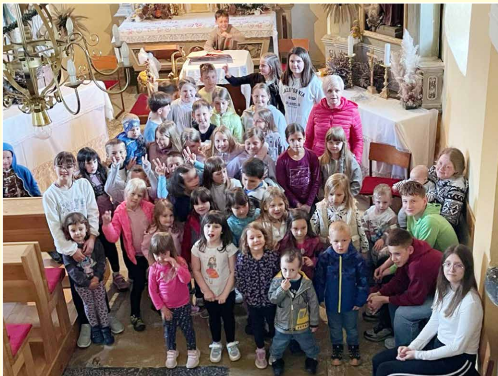
Šmarničarji v Rovišču – maj 2026